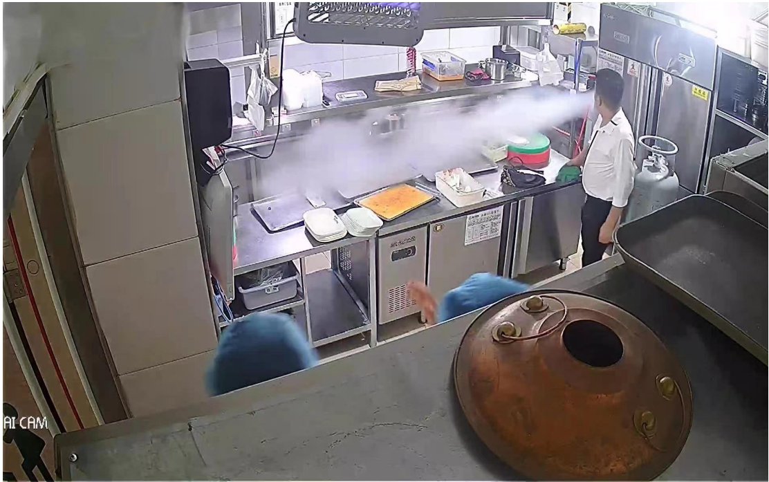
图 3 涉事气瓶泄漏时的厨房监控画面