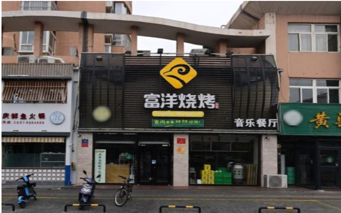
图1 事发前富洋烧烤店照片